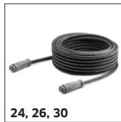
24, 26, 30