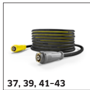
37, 39, 41-43