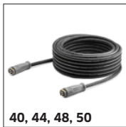
40, 44, 48, 50